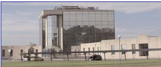
Edificio CEI (Centro de Empresas e Innovación) de Tecnópole, en Ourense.

Dentro desta nova campaña, o 15 de xullo tivo lugar a presentación da Rede Mentoring no Parque Tecnolóxico de Ourense, Tecnópole, e o 16 de xullo celebrouse unha reunión de presentación do mentoring a diversas entidades colaboradoras de Ferrol e comarca. Neste caso asistiron, entre outros, membros da Cámara de Comercio de Ferrol, da Asociación de Empresarios Ferrolterra, da UXT e representantes dos concellos de Narón, Ortigueira, Moeche, San Sadurniño, Fene, Ferrol e Mugardos.